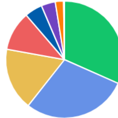
VALOR POR ÁREA DEMANDANTE