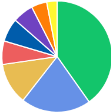
DFDS POR ÁREA DEMANDANTE