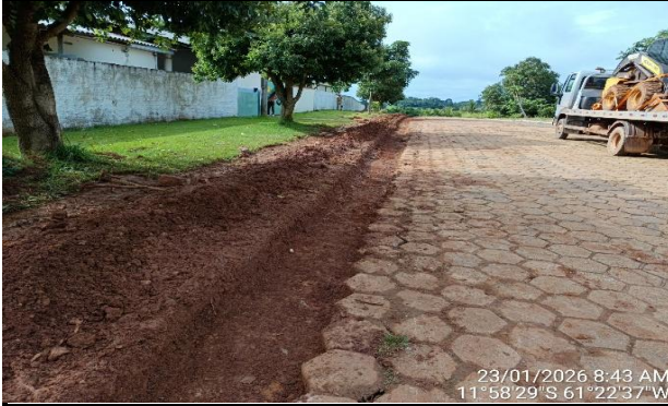
23/01/2026 8:43 AM 11°58'29"S 61°22'37"W