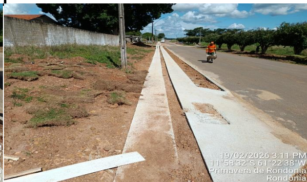
19/02/2026 3:11 PM 11°58'32"S 61°22'38"W Primavera de Rondonia Rondonia