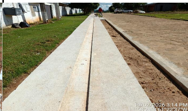
19/02/2026 3:14 PM 11°58'28"S 61°22'37"W