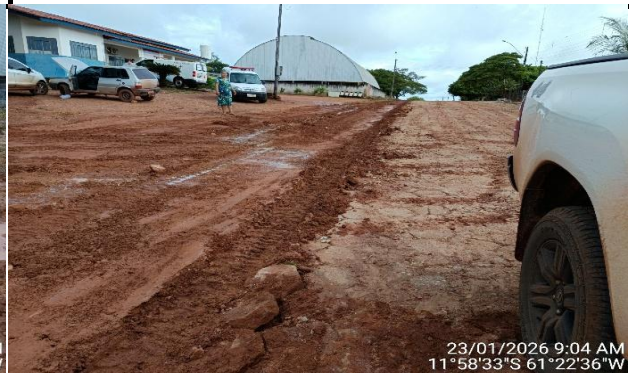
23/01/2026 9:04 AM 11°58'33"S 61°22'36"W