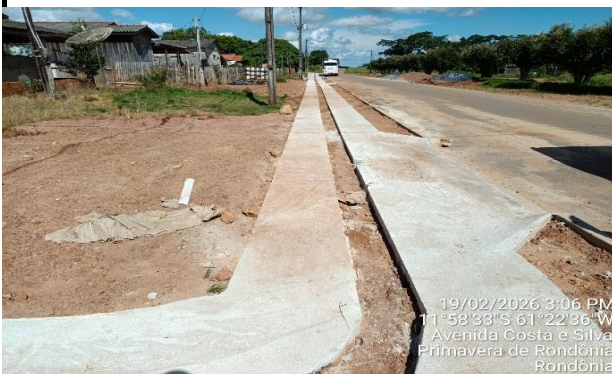
19/02/2026 3:06 PM 11°58'33"S 61°22'36"W Avenida Costa e Silva Primavera de Rondonia Rondonia