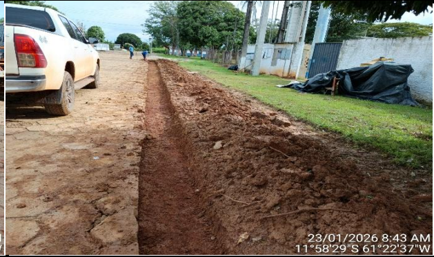
23/01/2026 8:43 AM 11°58'29"S 61°22'37"W