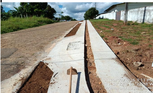
19/02/2026 3:11 PM 11°58'32"S 61°22'38"W Primavera de Rondonia Rondonia