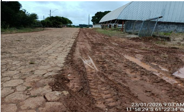
23/01/2026 9:03 AM 11°58'29"S 61°22'34"W