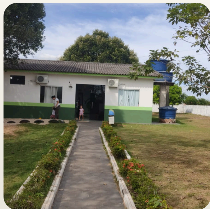
Creche Pingo de Gente