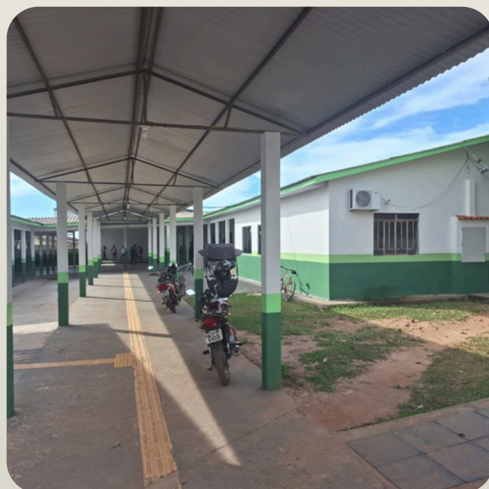
Esc. Mun. José Antônio Rodrigues