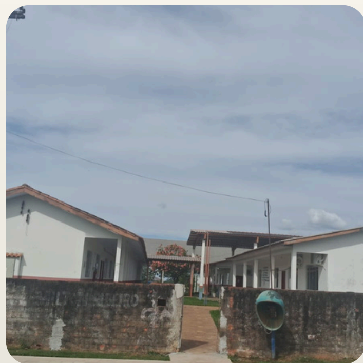
Esc. Mun. Amilton Ribeiro